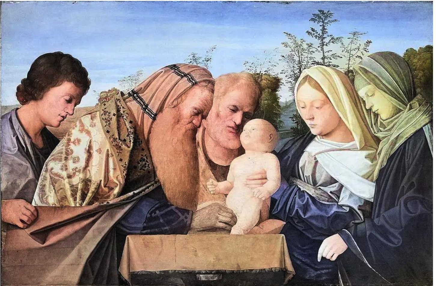
Un tablou din secolul al XV-lea realizat de artistul Giovanni Bellini îl înfățișează pe Isus fiind circumcis de rabini, în prezența lui Iosif și a Mariei.

Circumcizia este legământul veșnic dintre Dumnezeu și poporul Său — un grup de ființe umane sfinte, separate de restul populației. Acest grup a fost întotdeauna deschis tuturor și nu a fost niciodată limitat doar la descendenții biologici ai lui Avraam, cum presupun unii.